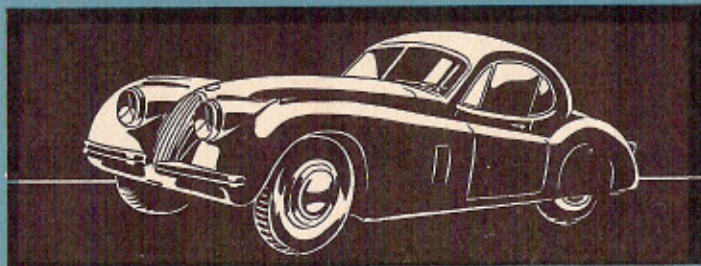
DISTLER ELECTROMATIC 7600 "JAGUAR"

Ausgerüstet mit dem DISTLER ELECTROMATIC -Hochleistungs-Batterie-Motor fahren diese Autos mit zwei 1,5 Volt Monozellen garantiert 50 Stunden im Spielbetrieb. Eine enorme Leistung!